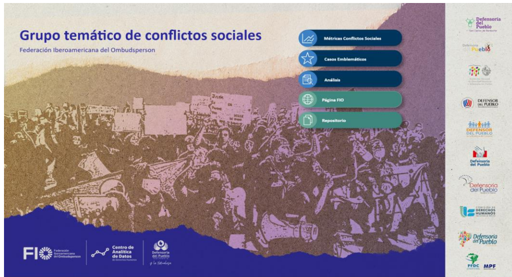
Ilustración 1. Portada del Tablero de Power Bi.