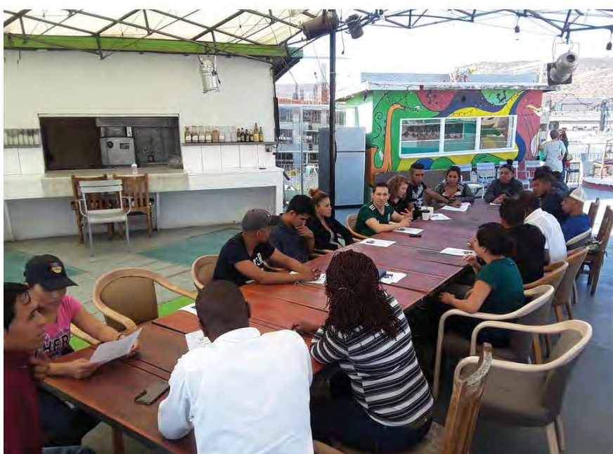
Plática sobre "Derechos Humanos de Personas en Contexto de Migración" impartida por personal de la CEDHBC ante Espacio Migrante en junio de 2018, en Tijuana, Baja California.