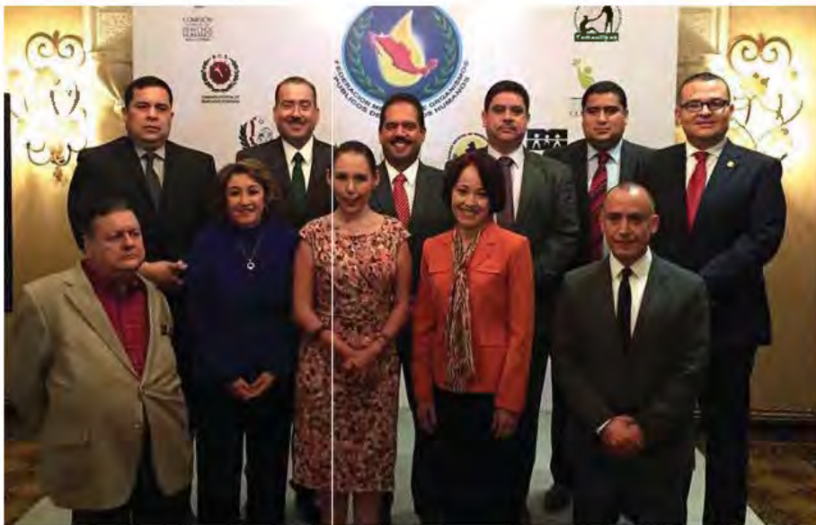
Reunión de integrantes de las Defensorías de la Región Norte de México, celebrada en marzo de 2016. en Coahuila.

Sin embargo, el presente aspecto que fue tomado en cuenta, muestra cuáles son las leyes y reglamentos que existen en los ocho estados de la región norte de México que protejan personas en contexto de migración independientemente de aquellas que emanan del derecho internacional o nacional antes mencionado.