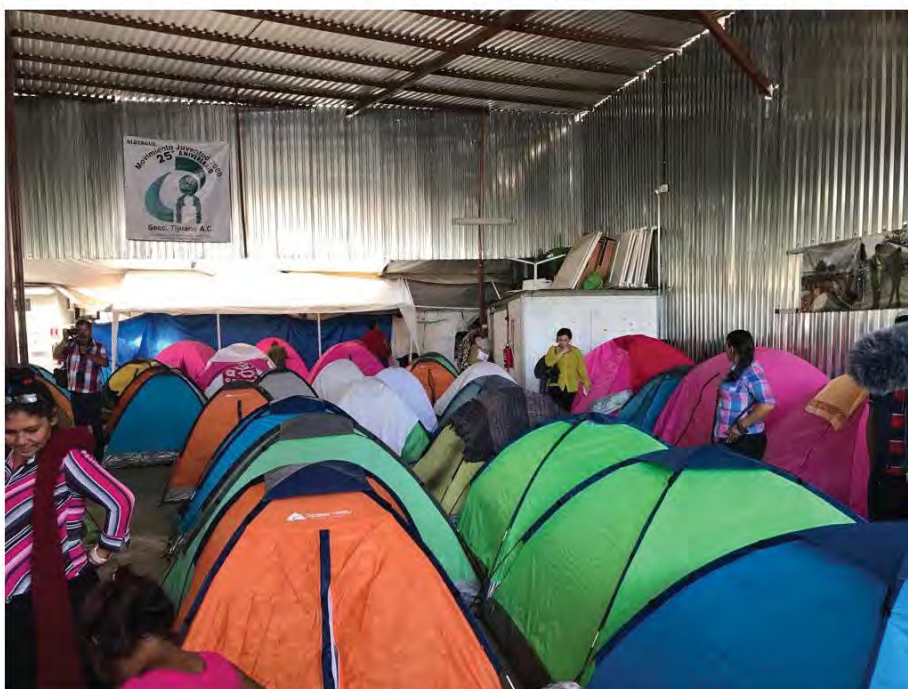
Caravana de personas en contexto de migración procedentes de Centroamérica, arribando al Albergue Juventud 2000, en abril de 2018, en Tijuana, Baja California.