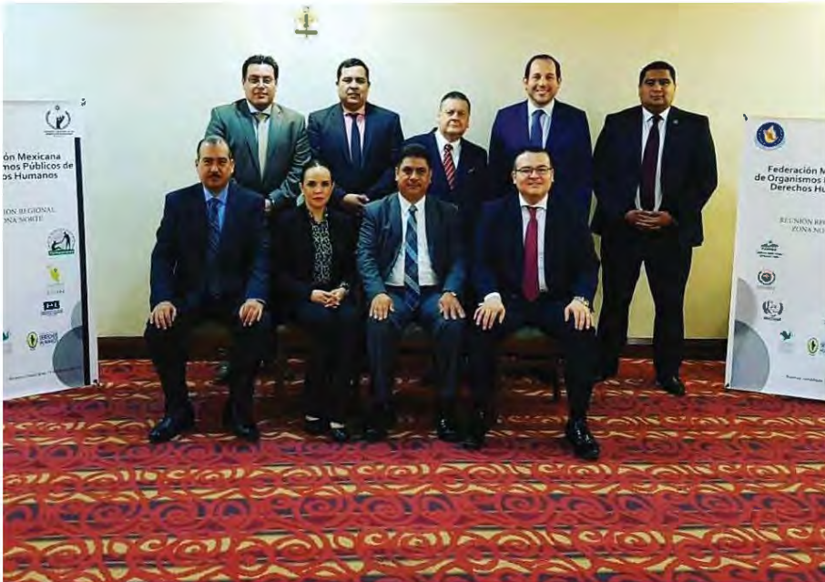
Reunión de integrantes de las Defensorías de la Región Norte de México, celebrada en febrero de 2017, en Tamaulipas.