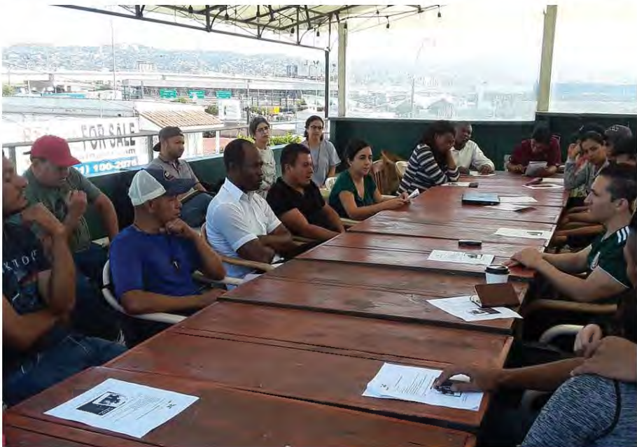
Plática sobre "Derechos Humanos de Personas en Contexto de Migración" impartida por personal de la CEDHBC ante Espacio Migrante en junio de 2018, en Tijuana, Baja California.