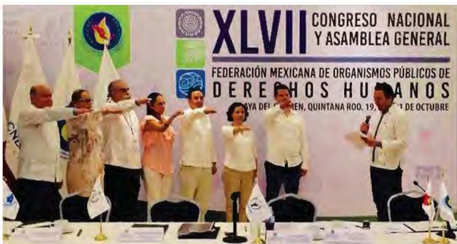
Reunión de integrantes de las Defensorías de la Región Norte de México, celebrada en octubre de 2017, en Quintana Roo.

Es importante capacitar a una mayor cantidad de personal para la atención de la población en contexto de migración, y generar estrategias para la atención de gestiones y orientaciones en la materia, ya que por la naturaleza de las violaciones, en algunos casos en diversos puntos de su trayecto, resulta complicada la integración e investigación de los expedientes de Queja. Debido a esto, también es necesario contar con áreas específicas ya sea Visitadurías o Coordinaciones, así como Programas con presupuesto asignado para la atención del tema.